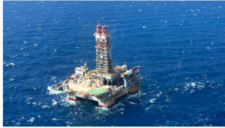
El pozo Uchuva-2, ubicado en aguas profundas frente al litoral de Santa Marta, es operado por Petróbras y tiene un carácter evaluador.