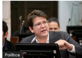
Política Miguel Uribe vs. Fiscalía: Interpone acción de tutela por directriz que despenaliza delitos durante protestas