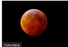
Colombia Así se verá el Eclipse lunar del 17 de septiembre en Colombia