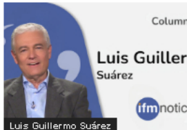
Opinión (OPINIÓN) ¿Qué Congreso queremos?. Por: Luis Guillermo Suárez Navarro