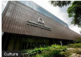
Cultura Cámara de Comercio de Medellín abre inscripciones para la convocatoria Nuevos Talentos en el Arte 2024 para Artistas jóvenes de Antioquia