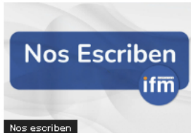
Opinión (NOS ESCRIBEN) Petro prepara la declaración de Comnoción Interior