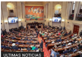
ULTIMAS NOTICIAS Cámara de Representantes de Colombia reconoce a Edmundo González como Presidente de Venezuela en votación histórica