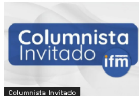
Opinión (OPINIÓN) El delicado equilibrio económico. Por: Juan Carlos Echeverry