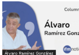
Opinión (OPINIÓN) Yo estuve en el 5-0 Colombia vs Argentina. Por: Álvaro Ramírez González