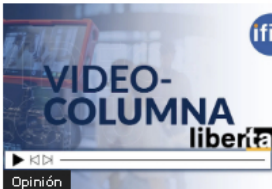
Opinión (VIDEOCOLUMNA) No es ser tacaño disfrutar del fruto de nuestro trabajo