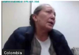
Colombia Las órdenes desde la Casa de Nariño: Nuevos detalles en el escándalo de las chuzadas y polígrafo ilegal a la niñera de Laura Sarabia