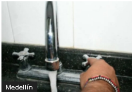
Medellín Varios sectores de Medellín e Itagüí a recoger agua esta semana