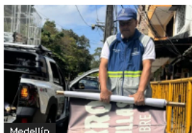
Medellín Subsecretaría de Espacio Público de Medellín ha realizado 3,600 desmontes de publicidad exterior