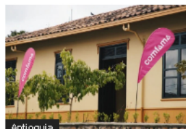
Antioquia Comfama impulsa el desarrollo de Antioquia con inversiones significativas que aportan a la