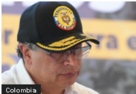
Colombia Dipol desmiente acusaciones de Petro sobre la adquisición del software espía Pegasus