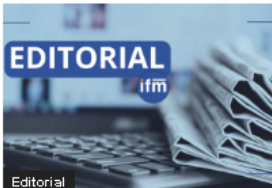
Editorial (EDITORIAL) La escopolamina en Medellín, una tragedia en aumento que exige acción inmediata