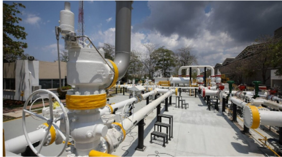
Planta que se encarga del suministro de gas natural

Publicado: Lunes, Septiembre 16, 2024 - 13:30 | Actualizado: Lunes, Septiembre 16, 2024 - 13:30