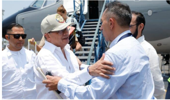
Presidente Gustavo Petro y Ricardo Roa, presidente de Ecopetrol.

Este lunes se llevará a cabo una plenaria del Consejo Nacional Electoral (CNE) para analizar la presunta violación de topes electorales en la campaña presidencial de Gustavo Petro en 2022.