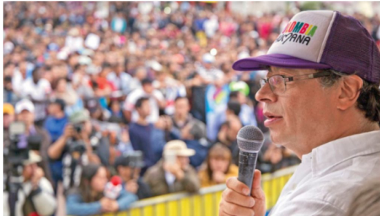
El presidente Gustavo Petro ha dicho que se estaría aplicando un golpe de Estado en su contra, aunque no presentó pruebas.

Esta sesión del CNE representa un momento crucial tanto para la campaña de Petro como para el futuro político del país, con implicaciones que podrían ir más allá de los resultados de la investigación.