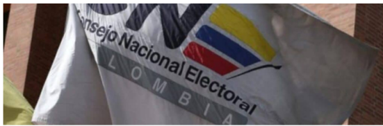
Consejo Nacional Electoral.

Sin embargo, el CNE ha dejado claro que la investigación no afecta el fuero presidencial y se centra únicamente en posibles irregularidades en la campaña electoral.