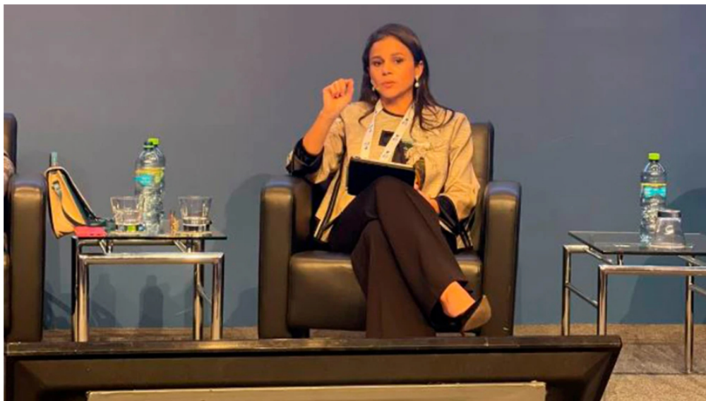
Presidenta de Naturgas, Luz Stella Murgas

Por: Redacción BLU Radio | 17 de Septiembre, 2024