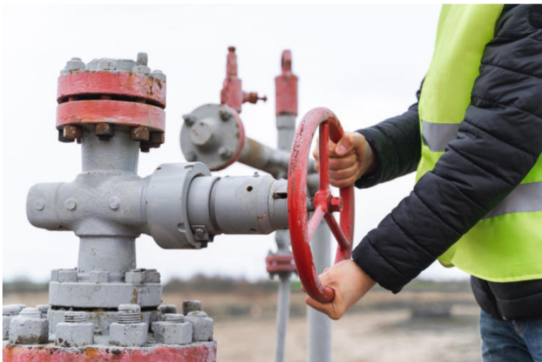
Estación de gas imagen de referencia.

Historia de Luisa María Mercado • 14 h • 2 minutos de lectura