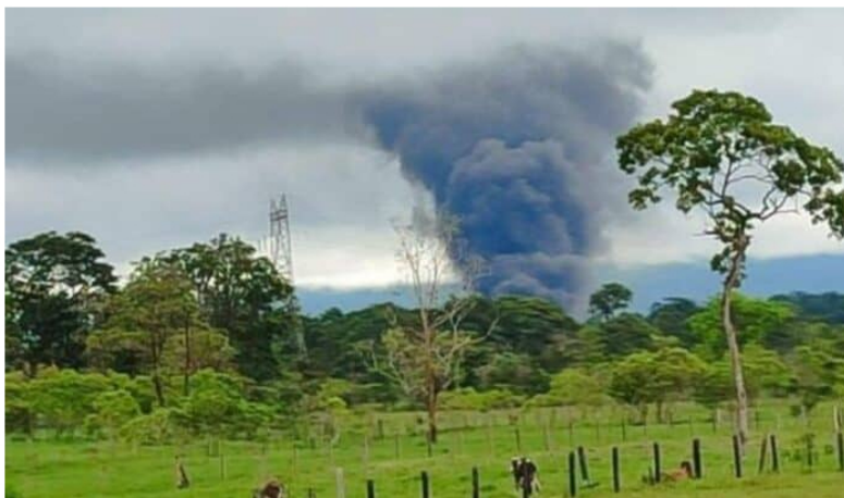
Reportan nuevo atentado en contra del Oleoducto Caño Limón – Coveñas.