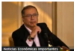
Noticias Económicas Importantes

No habrá Día Sin Carro y Sin Moto en Bogotá durante septiembre