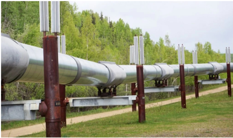
Cenit reporta atentados en Oleoducto Caño Limón-Coveñas.